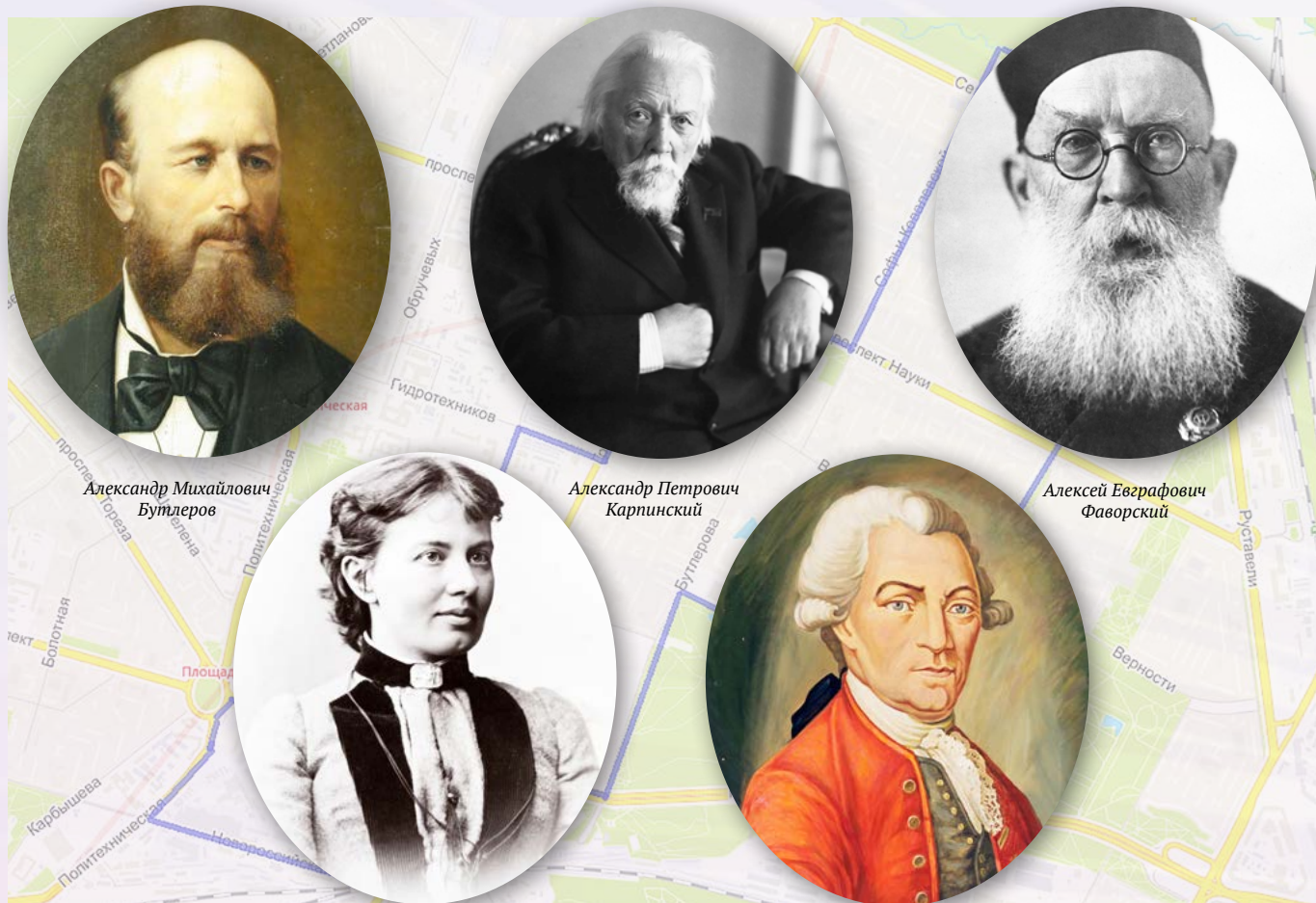
Александр Михайлович Бутлеров

ОКРУГ ГРАЖДАНКА НЕРАЗРЫВНО СВЯЗАН С ИСТОРИЕЙ РУССКОЙ И СОВЕТСКОЙ НАУКИ. ЭТА СВЯЗЬ ЗАПЕЧАТЛЕНА НЕ ТОЛЬКО В НАЗВАНИИ ГЛАВНОЙ МАГИСТРАЛИ – ПРОСПЕКТА НАУКИ, НО И В ИМЕНАХ МНОЖЕСТВА ПРИЛЕГАЮЩИХ УЛИЦ. ОНИ ОБРАЗУЮТ СВОЕОБРАЗНЫЙ «НАУЧНЫЙ КВАРТАЛ», ГДЕ КАЖДАЯ ТАБЛИЧКА С НАЗВАНИЕМ – ДАТЬ УВАЖЕНИЯ ВЫДАЮЩЕМУСЯ УМУ.