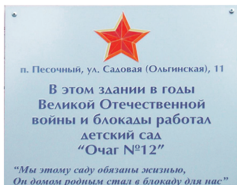
Мемориальная доска на фасаде детского сада представляет собой не только памятник истории, но и напоминание о героическом подвиге воспитателей

в качестве педагогов. Ну и, разумеется, многие родители, что выросли здесь, приводят потом к нам своих детей, что мы очень ценим. Все-таки доверие родителя – это, пожалуй, главная благодарность воспитателю.