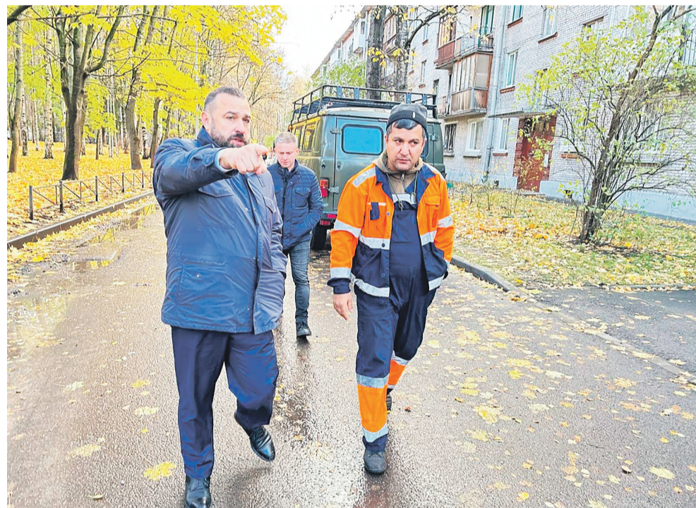
ул. Бутлерова, д. 22/2

Впереди много работы. Сейчас на этапе согласования бюджет муниципалитета на 2025 год. В нем обязательно учтем все задачи, которые необходимо реализовать в следующем году по благоустройству округа.