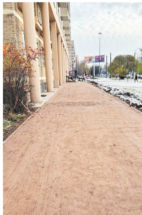
пр. Непокоренных, д. 14/2