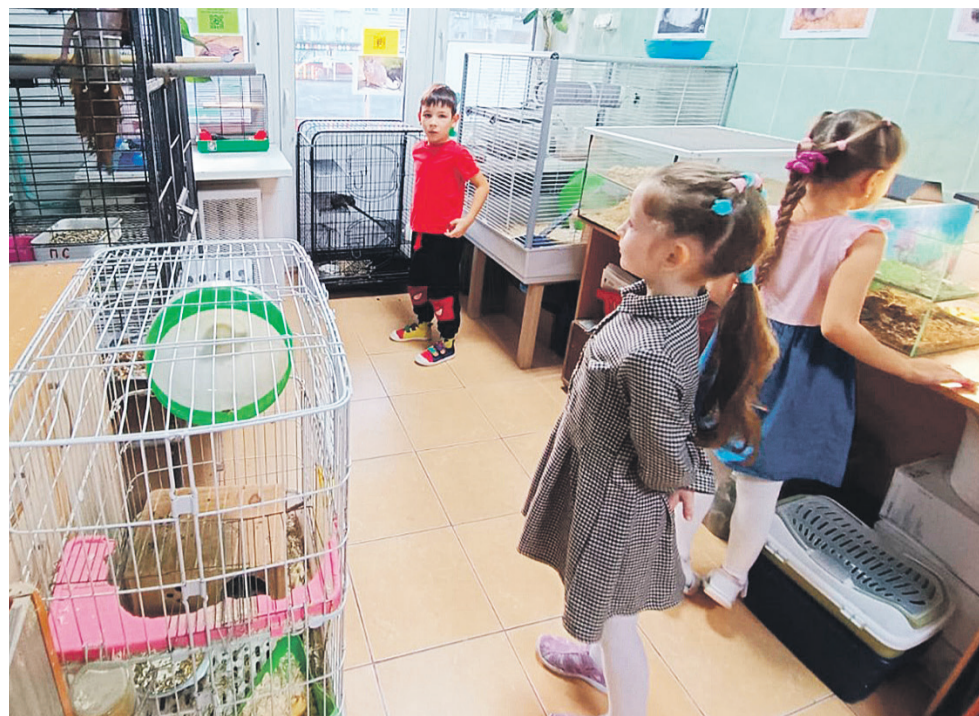
ГБДОУ №36 является единственным дошкольным учреждением в Калининском районе, имеющим собственный зоопарк, который посещают дети из садов всего округа

Не менее важно создавать условия для раскрытия творческого и интеллектуального потенциала детей. Мы регулярно проводим конкурсы, викторины и принимаем активное участие в мероприятиях всероссийского, городского, районного уровня. Все это позволяет и нам, и детям ощущать себя частью большой семьи.