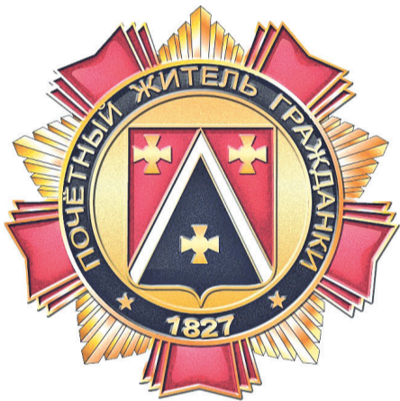
Знак «Почётный житель Гражданки»

Продолжаем добрую традицию нашего округа – отмечать жителей Гражданки наградой за вклад в её развитие, повышение её известности, за укрепление демократии и защиту прав человека, за вклад в науку, искусство, духовное и нравственное развитие общества.