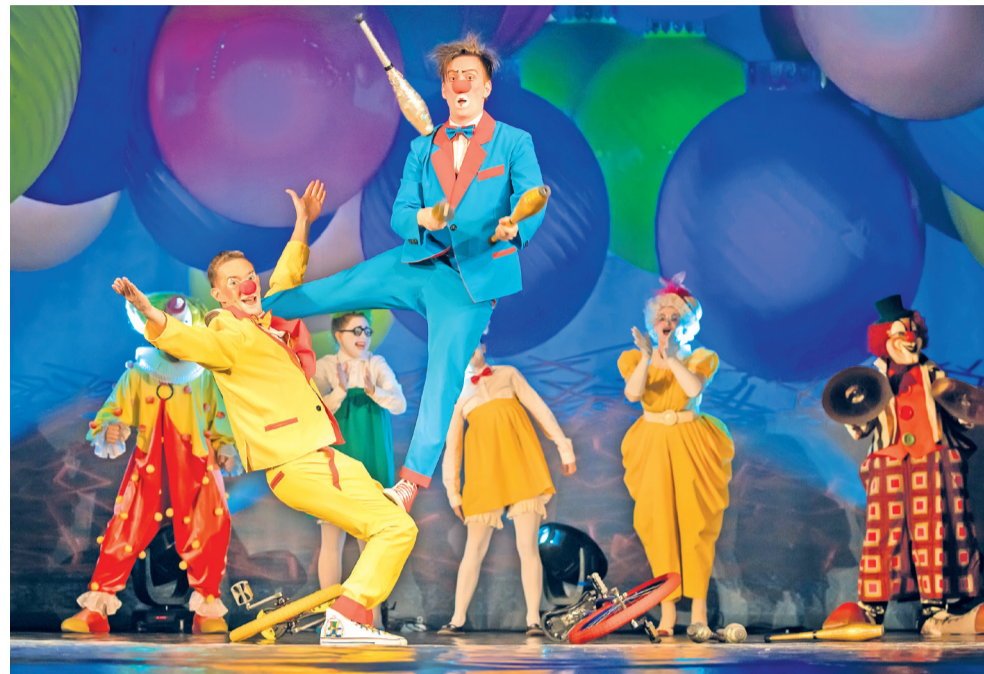
Семьи округа побывали на цирковом представлении «Надо верить в чудеса»