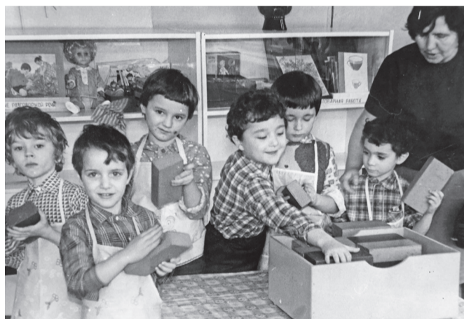
Этот конструктор хранится в детсаду до сих пор. 1973 г.

– Знаете, когда предыдущая заведующая уходила со своей должности, то сильно переживала за судьбу детского сада. Думаю, она была бы довольна тем, что мы не просто сохранили лучшие педагогические традиции, но и сумели их развить. Сейчас в детском саду 12 групп и около 300 воспитанников. Мы являемся детским садом года, инновационной площадкой, победителями всероссийских конкурсов. В этом году завершаем масштабный проект по формированию финансовой грамотности у дошкольников, планируем подать повторную заявку и продолжить работу в этом направлении. Также действует система дополнительного образования: прощя говоря, по желанию ребята могут посещать «кружки», например, изучать математику или учиться читать. Надеюсь, что этот опыт и далее будет только приумножаться!