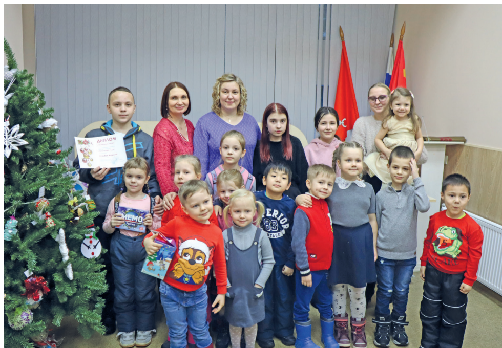
Награждение победителей конкурса ёлочных игрушек «Новогоднее чудо»

64 ПРАЗДНИЧНЫХ МЕРОПРИЯТИЯ БЫЛО ОРГАНИЗОВАНО