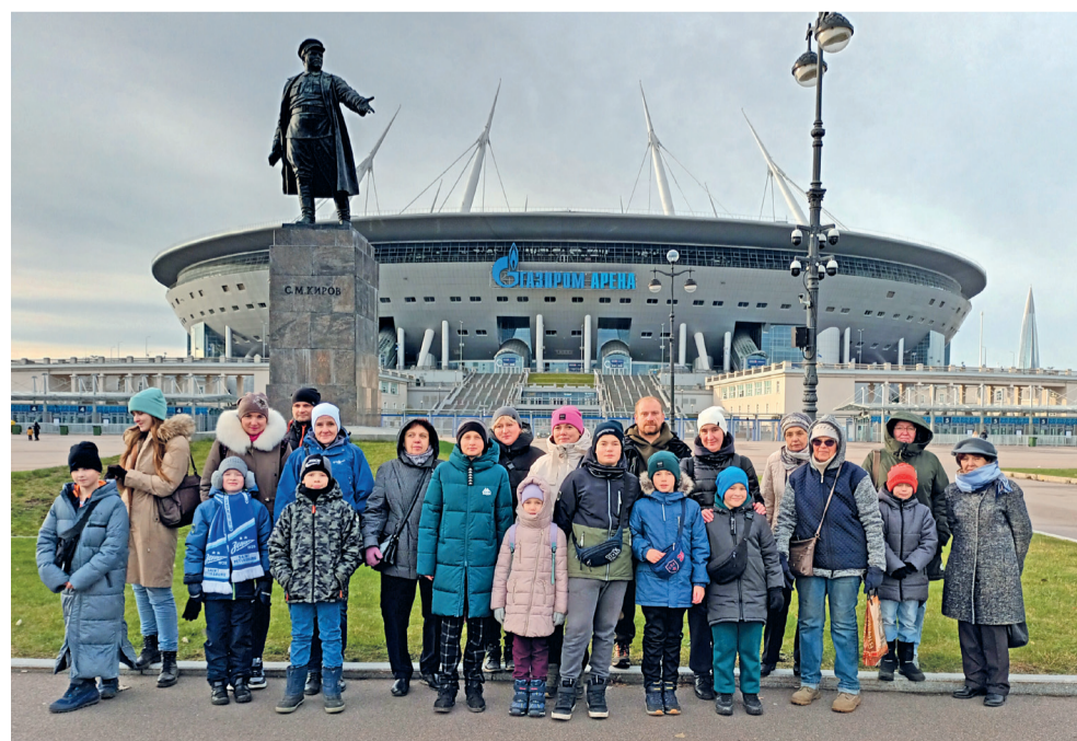
Экскурсия для жителей по стадиону «Газпром Арена»

Благодарим всех, кто участвовал в наших праздниках и конкурсах, посетил концерты, спектакли и экскурсии. Впереди у нас много новых событий! До встречи на муниципальных мероприятиях!