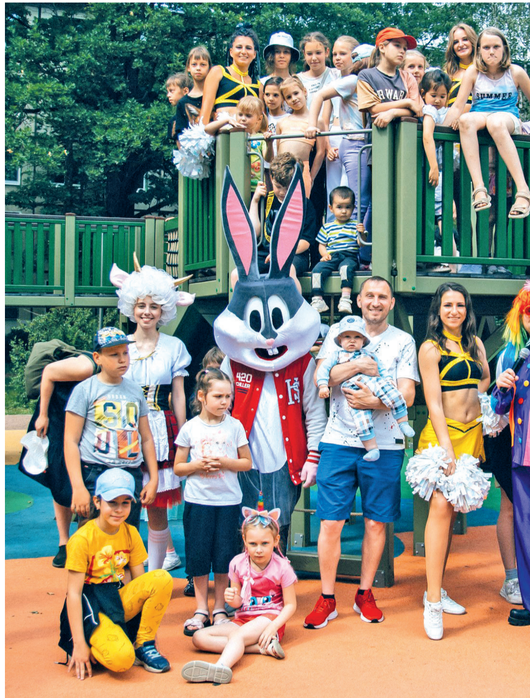
Яркий уличный праздник «Детство – лучшая планета!» на площадке

Ещё одной важной традицией МО Гражданка стало проведение уличных праздников, приуроченных к открытию новых общественных пространств, а также к различным торжественным датам. Программа каждого мероприятия всегда со-