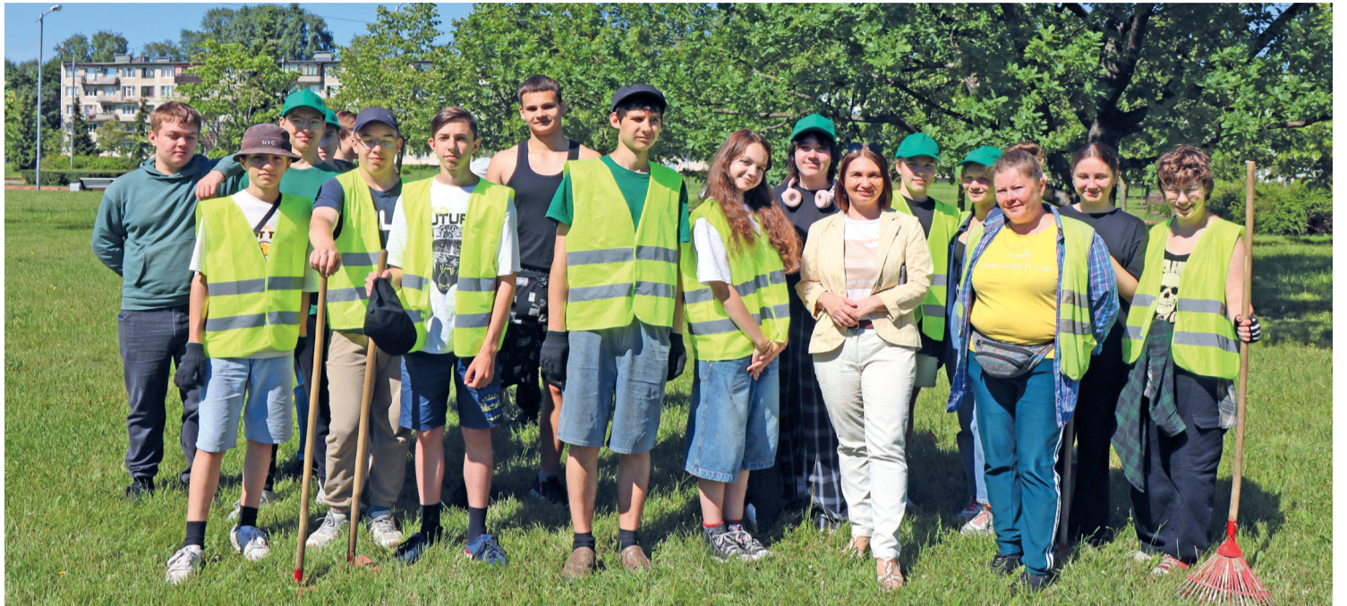
Трудовой отряд. 2024 г.

Самое приятное всегда это, конечно, вознаграждение. За полностью отработанный месяц подростки получают 12 500 рублей (до вычета налогов) и компенсацию за неиспользованный отпуск. Кроме того, Агентство занятости населения дополнительно предоставляет ребятам матери-