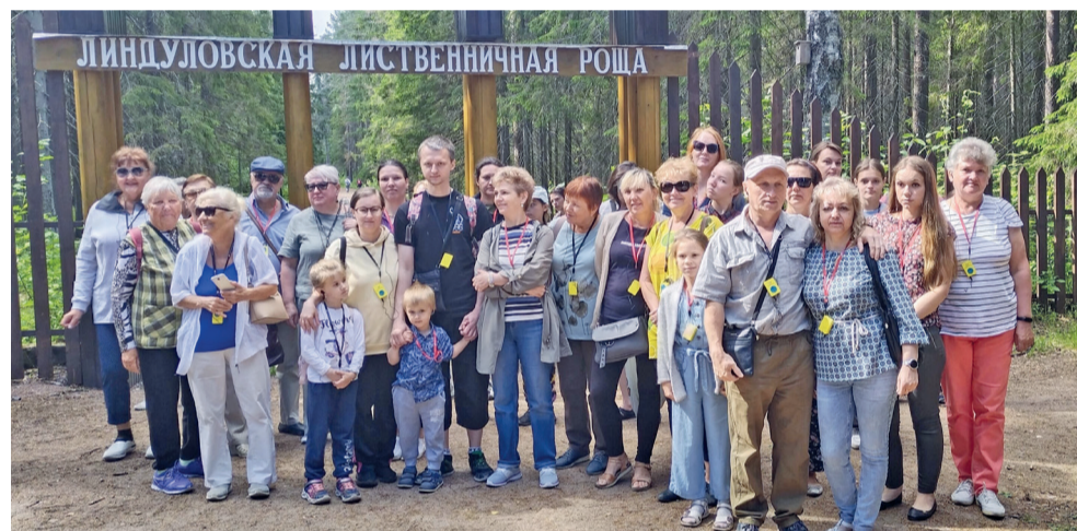
Жители на экскурсии по экотропе «Линдуловская роща»