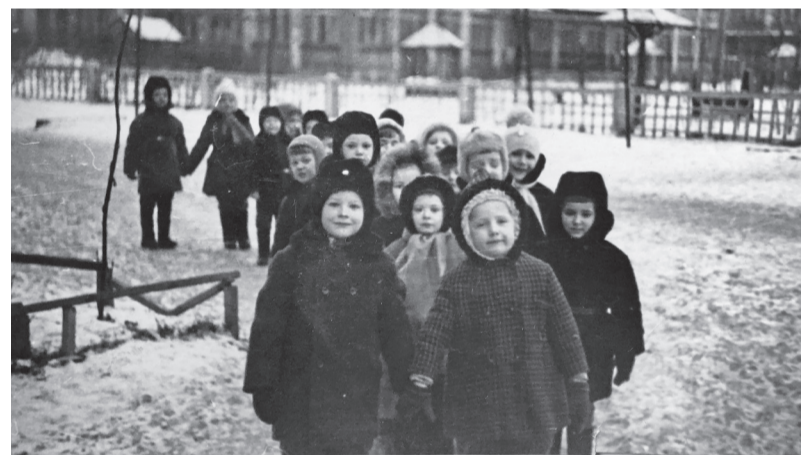
Воспитанники детского сада № 37 на прогулке. 1973 г.

Вступайте в нашу группу «ВКонтакте» и узнавайте актуальные новости первыми!