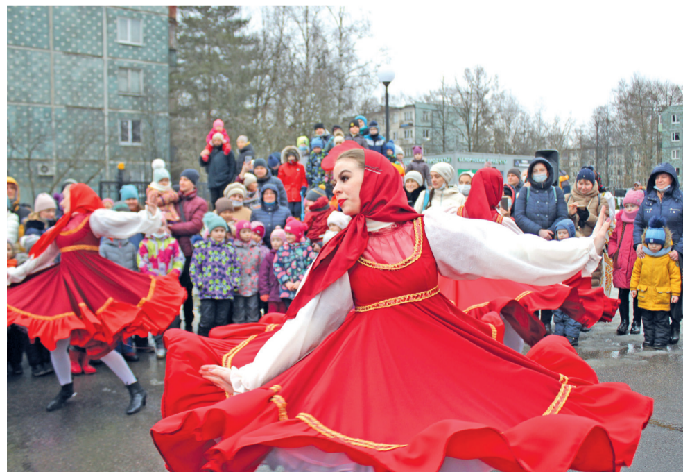
Уличный праздник в честь Масленицы у Храма Тихвинской иконы Божией Матери