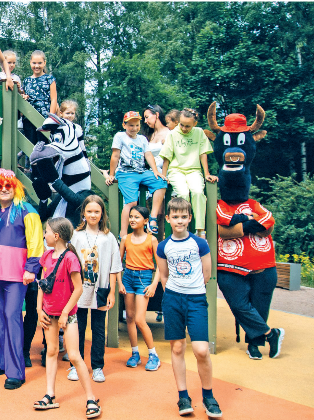
Игры по адресу: ул. Карпинского, д. 6–10, порадовали и взрослых, и маленьких жителей Гражданки