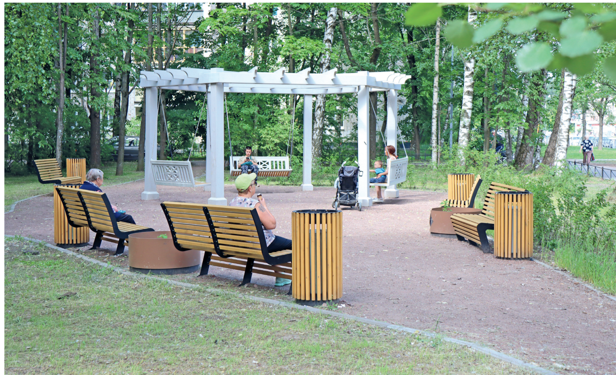
В 2023 году в рамках комплексного благоустройства было создано новое общественное пространство с удобной зоной отдыха в сквере на пр. Науки, д. 41

Этот год был посвящён реализации проектов комплексного благоустройства