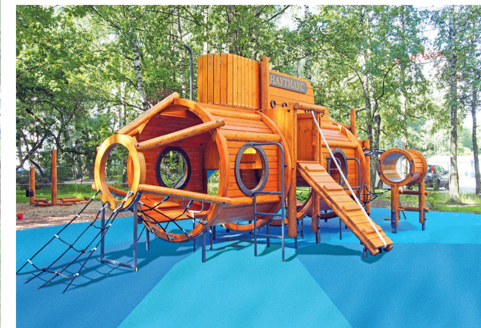
Детская площадка на ул. Софьи Ковалевской, д. 15, корп. 3-4

4 560 ШТ. ДЕРЕВЬЕВ И КУСТАРНИКОВ ВЫСАЖЕНО НА ТЕРРИТОРИИ ОКРУГА В РАМКАХ РАБОТ ПО ОЗЕЛЕНЕНИЮ