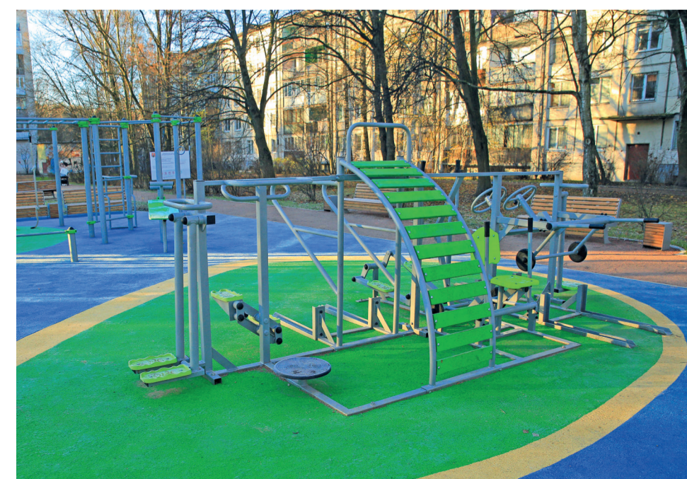
По адресу ул. Карпинского, д. 6-10, размещены детская и спортивная площадки с современным оборудованием и травмобезопасным покрытием

В 2023 году муниципалитет выполнил комплексное благоустройство ещё по пяти адресам: пр. Науки, д. 25; пр. Науки, д. 41; Гражданский пр., д. 31; Граждан-