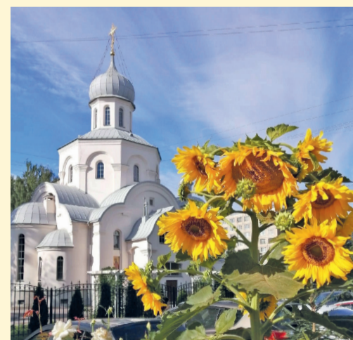
Конкурсная работа Олеси Красовской

Спасибо всем участникам конкурса! Приглашаем победителей на награждение в Местную администрацию МО Гражданка (пр. Науки, д. 41) до 28 июня: по средам и пятницам с 14:00 до 17:00.