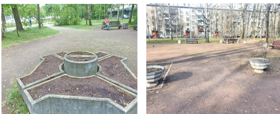
Так выглядели скверы на пр. Науки, д. 41, и на Гражданском пр., д. 25, до того, как территорию округа начали приводить в порядок