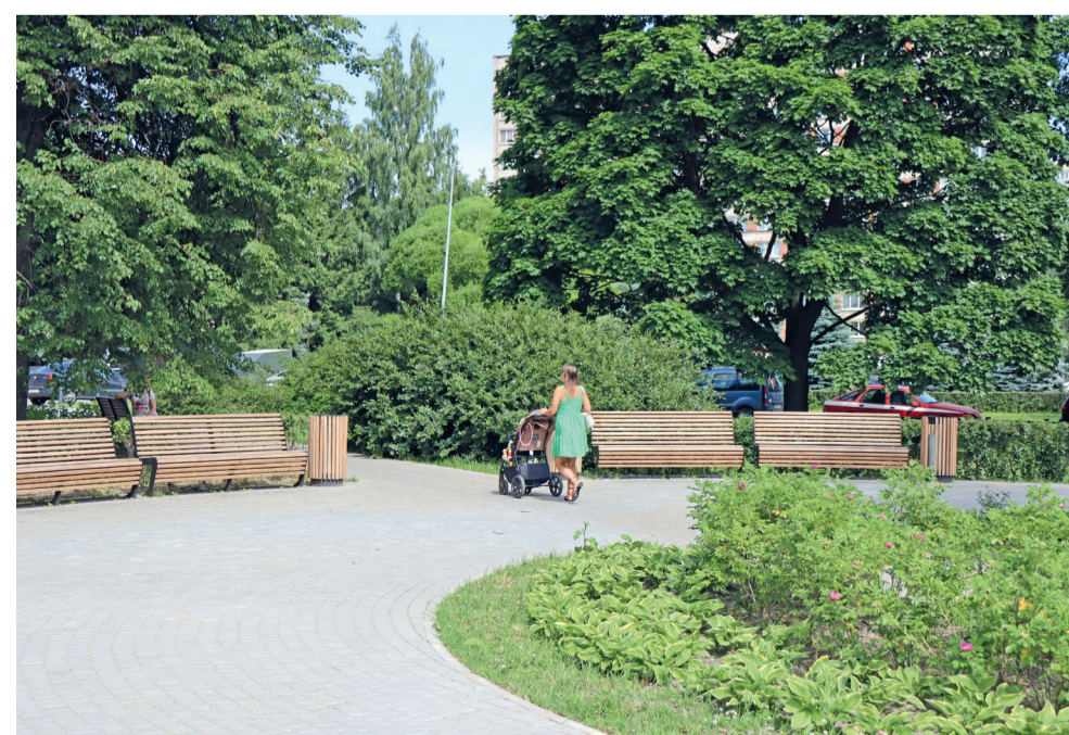
Благоустроенная зона отдыха в сквере на пр. Науки, д. 25

В год 195-летия исторического района Гражданка муниципалитет провёл