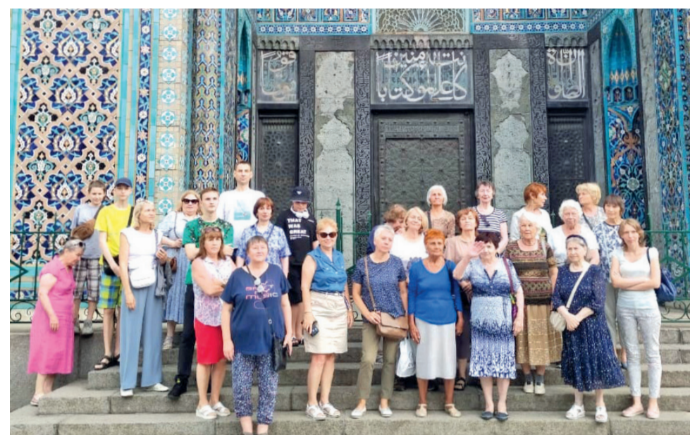
Участники экскурсии «Город разных религий»

Одним из основных принципов миграционной политики является приоритет интересов РФ и её граждан, а также учёт многообразия региональных и этнокультурных укладов жизни населения Российской Федерации, среди задач – совершенствование правовых и организационных механизмов въезда и пребывания иностранцев в РФ, а также создание условий для их адаптации к условиям жизни в стране.