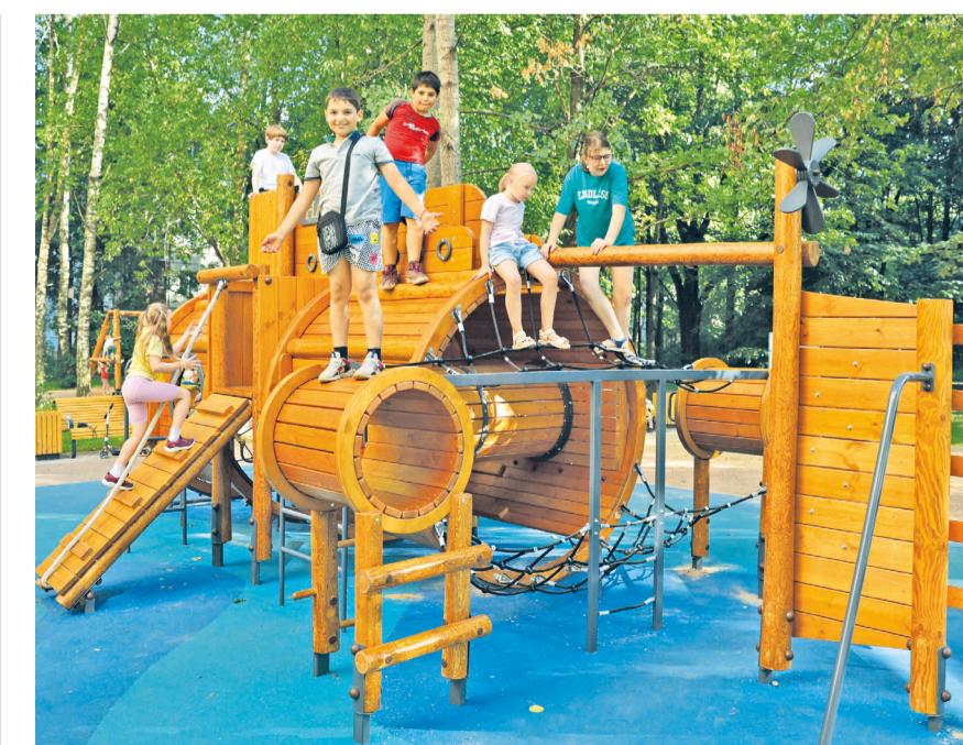
Новая детская площадка по адресу ул. Софьи Ковалевской, д. 15, корп. 3-4

98 деревьев, подлежащих сносу, выявлено 49 деревьев удалено