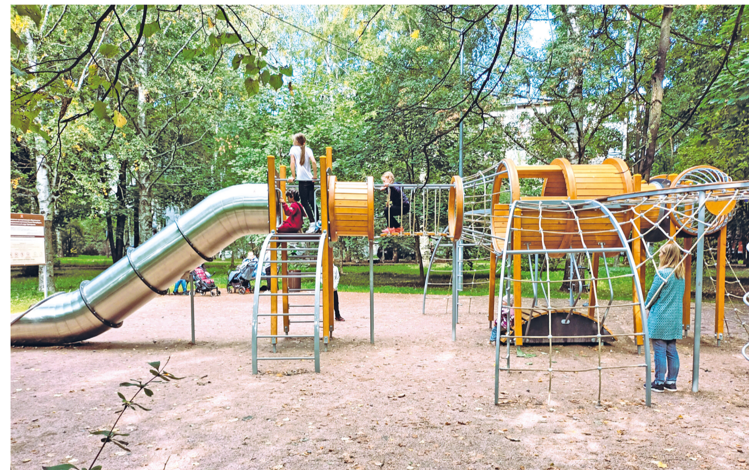
В сквере на Гражданском пр., д. 25, создали общественное пространство с детскими и спортивной площадками в экостиле

Кроме реализации проектов комплексного благоустройства, учитывая пожелания жителей, мы также установили новые уличные диваны на проспекте Науки у памятника «Лётчикам Краснознамённой Балтики».