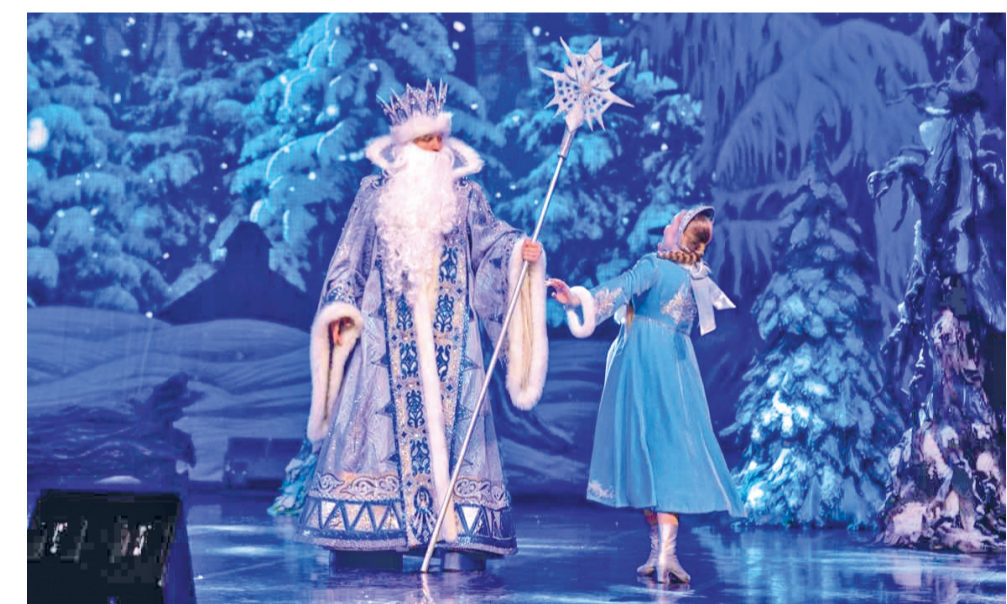
Накануне Нового года жители посетили хореографическую сказку «Снегурочка»

Есть ли билеты на спектакли? Когда начнутся экскурсии? Будут ли подарки детям к Новому году? С этими вопросами жители очень часто обращаются к нам в муниципалитет. В течение года в округе организовывается множество самых разнообразных мероприятий для всех возрастов. Рассказываем, как мы вместе с жителями весело и дружно проводили досуг, отмечали праздники и занимались спортом в 2023 году.