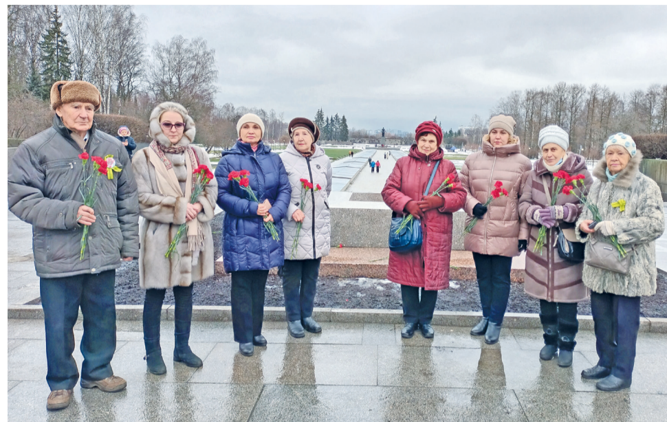
На Пискаревском мемориальном кладбище с активом общества «Жители блокадного Ленинграда» Калининского района

Мы уверены, что экологическая культура и любовь к окружающей среде должны прививаться с детства. Поэтому юные жители округа активно привлекаются к муниципальным экологическим акциям по сбору макулатуры, посадке зелёных насаждений, раздельному сбору отходов. Для ребят младшего возраста прошли две акции по устройству кормушек: «Покорми птиц» и «Столовая для пернатых». Приятно, что всё больше желающих присоединяются к нашей акции по сбору макулатуры: в прошлом году совместными усилиями мы сдали на переработку более 1,5 тонн бумажных отходов! Сданное вторсырьё обменяли на саженцы, которые во время осеннего месячника по благоустройству высадили в скверах округа.