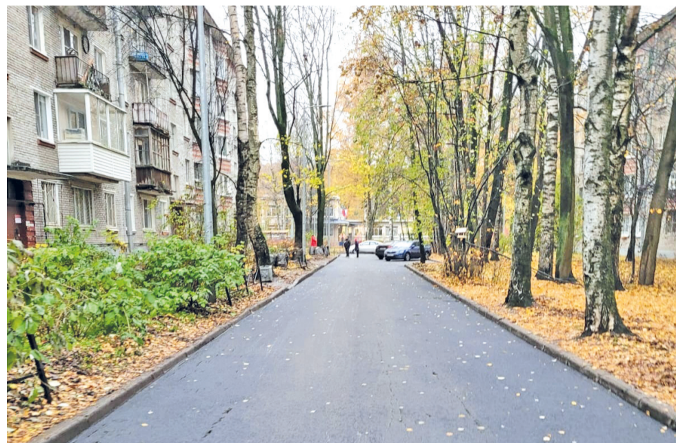
На ул. Бутлерова, д. 26, лит. А, заменили асфальт

Установили 20 «лежачих полицейских» по десяти адресам.