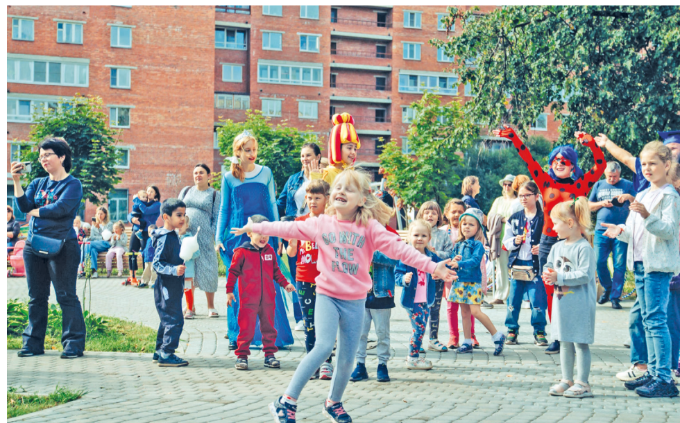
Уличный праздник, посвящённый Дню знаний, на пр. Науки, д. 25

тей, фотоконкурс урожая для садоводов и огородников. В прошлом году к ним прибавились ещё два новых необычных конкурса рисунков – «Деды Морозы России» и «Национальный костюм народов России». Участников и победителей наших активностей мы награждаем подарками и дипломами.