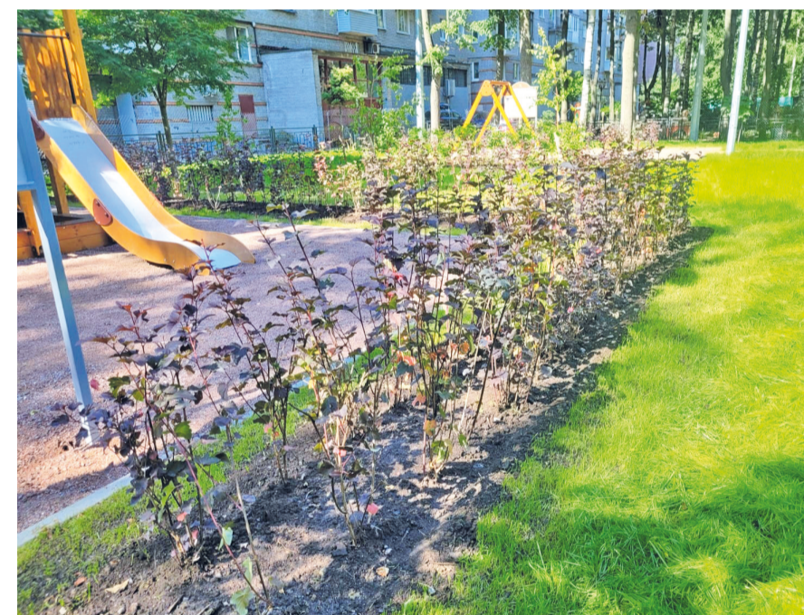
Проведены работы по озеленению в сквере на Гражданском пр., д. 31