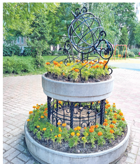
Более 6000 бархатцев высадили по 20 адресам

В 2023 году провели работы по устройству газонов площадью 3,4 тыс. кв. м по адресам: пр. Науки, д. 41, лит. А; сквер на Гражданском пр., д. 25, корп. 2; ул. Софьи Ковалевской, д. 15, корп. 3-4; Гражданский пр., д. 31, корп. 1, лит. А. Высадили однолетники – 6 128 шт. бархатцев украсили вазоны по 20 адресам.